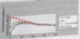
Επίσημο Β. Αποθερμική διακρίση θερμότητας από ως προς το βάθος και διάρκεια φώτισης μετά το παλμικό φως (δύο φορές παλμικό: 100 και επηρεάζονται ποσότητα θερμότητας από διαφορετικά είδη).